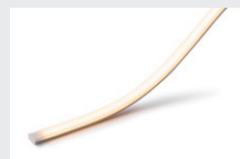
リミットフレックスTof